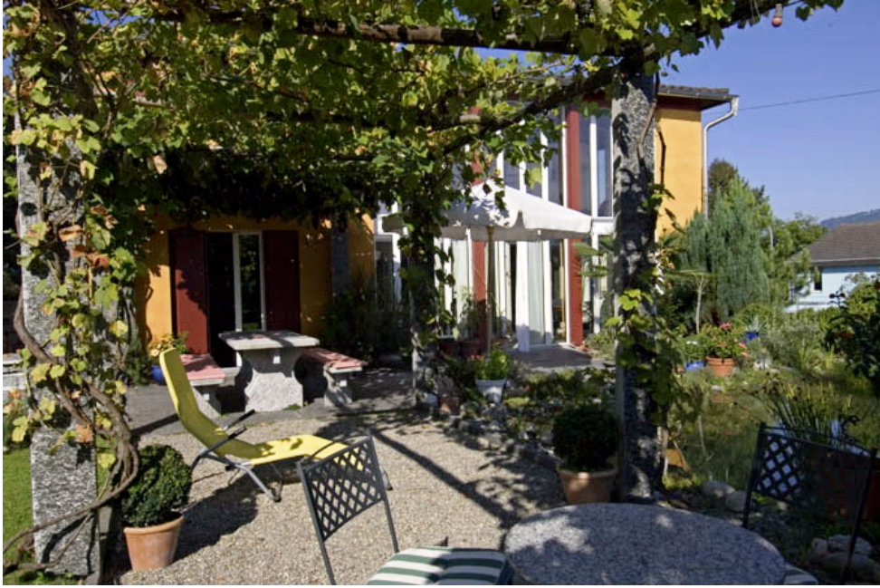
Für die Gartengestaltung wurde Maggia-Granit verwendet. (Bild 10)